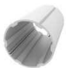
Alumínium körprofil 89 mm